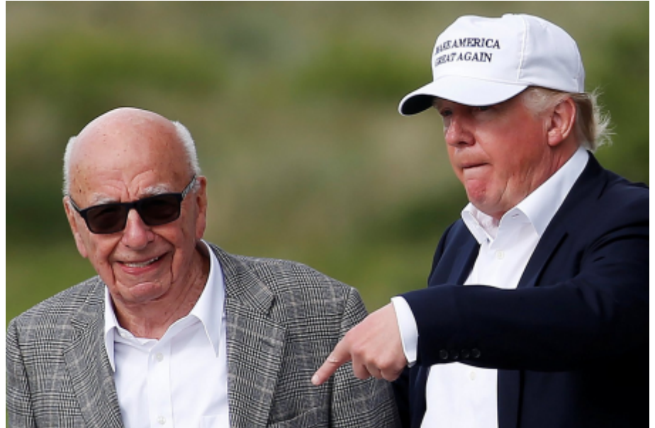
Murdoch & Trump på "Trump International Golf Links" i Aberdeen juni 2016

Han vælger i stedet at tage imod direktørjobbet i CIA, men hans tid som direktør bliver kortvarig. Sommeren 2012 dukker historier